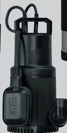
NOVA SALT W